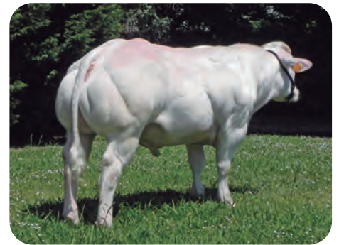
Blanco A. Belga: GREC / OR / PELICAN