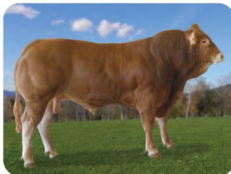
Limousina: EPSILON / MANSO / NAIME