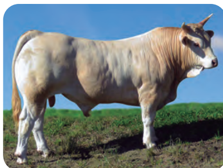
Pirenaica: IRRINTZI / JUSTO