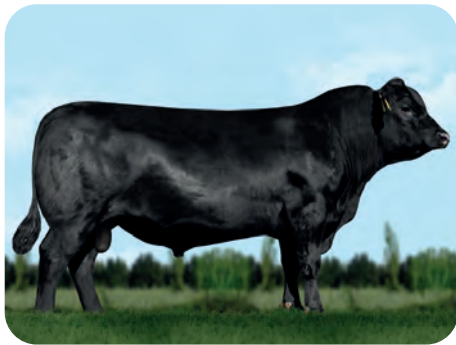
Angus: CENTER / GUENTHER / HILLER