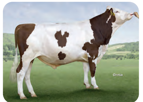
Montbeliard: JORKY / OSS