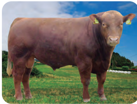
Angus Rojo: TITUS