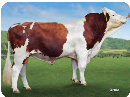
Fleckvieh: CRISOL / GALANO