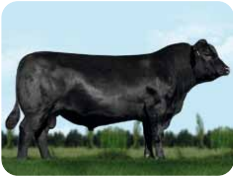
Angus: CENTER / GUENTHER / HILLER