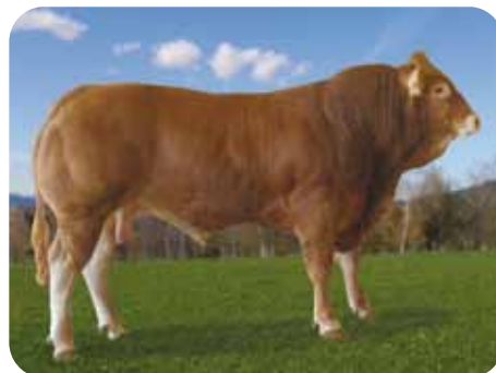
Limousina: EPSILON / MANSO / NAIME