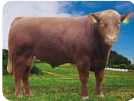
Angus Rojo: TITUS