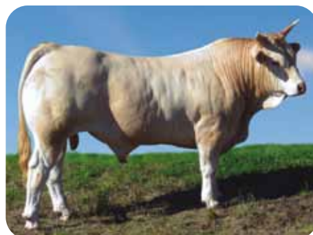
Pirenaica: IRRINTZI / JUSTO