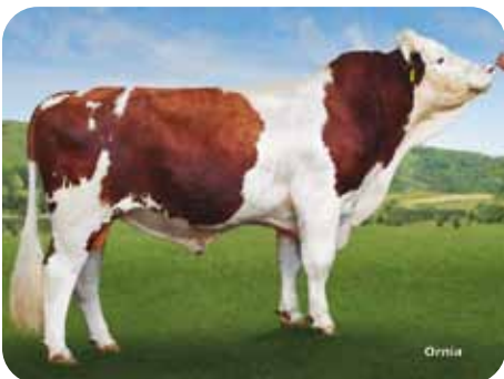
Fleckvieh: CRISOL / GALANO