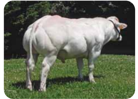
Blanco A. Belga: GREC / OR / PELICAN