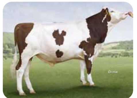
Montbeliard: JORKY / OSS