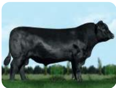
Angus: CENTER / GUENTHER / HILLER