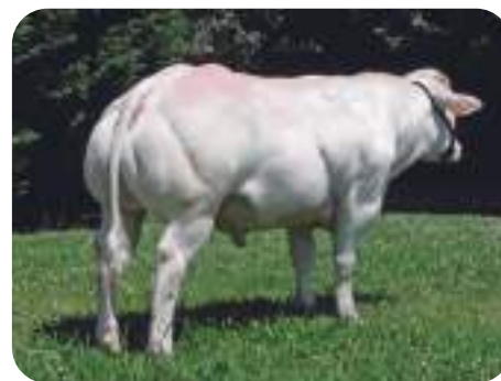
Blanco A. Belga: GREC / OR / PELICAN