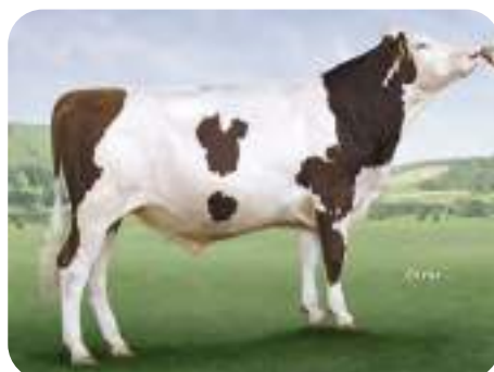
Montbeliard: JORKY / OSS