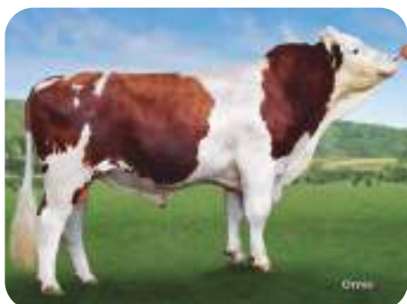
Fleckvieh: CRISOL / GALANO