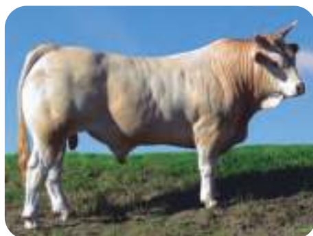
Pirenaica: IRRINTZI / JUSTO