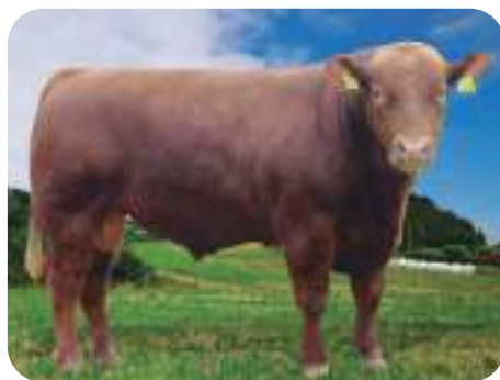
Angus Rojo: TITUS