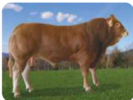
Limousina: EPSILON / MANSO / NAIME