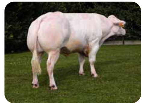
Blanco Azul Belga: TENOR